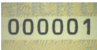
Nummer im Buchdruck